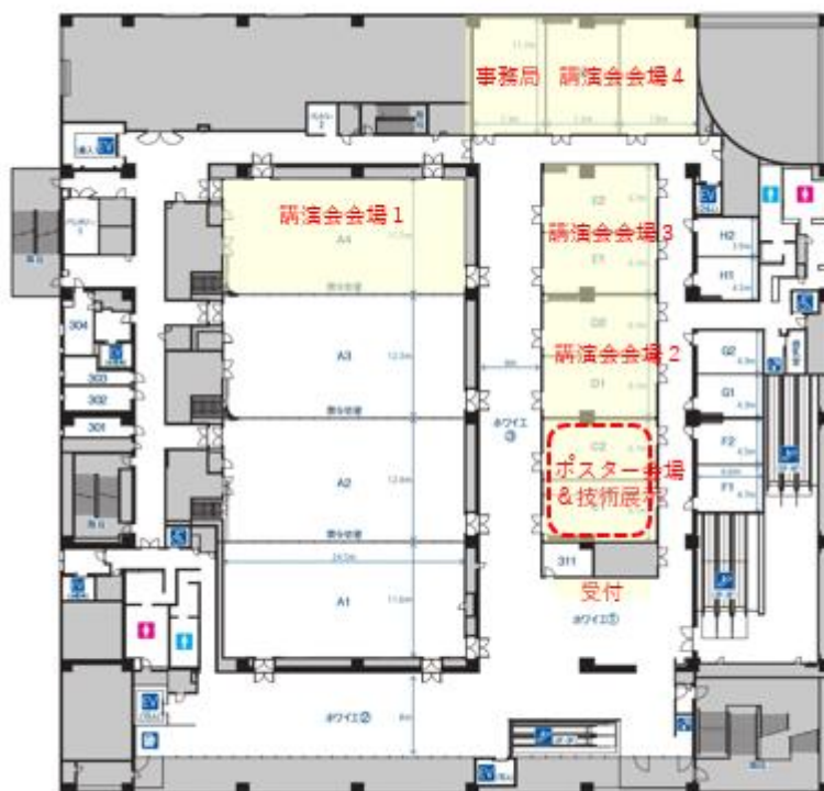
熊本城ホール3階フロアマップ