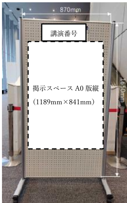
ポスター掲示パネル正面